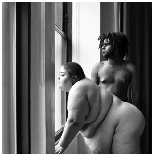
Obrázok 11 The Adipositivity Project

Dáva si za cieľ zviditeľniť v reklame a médiách tučných ľudí aby sa necítili byť neviditeľný. Vo svojej tvorbe kritizuje americký priemysel zameraný na chudnutie ktorý používa tučných ľudí ako odstrašujúci príklad. Zároveň odsudzuje médiá a reklamné fotografie ktoré prezentujú že byť tučný je hanba, je to zlé a chybné.