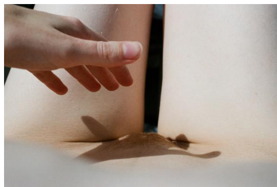
Obrázok 9 Lyna Scheynius