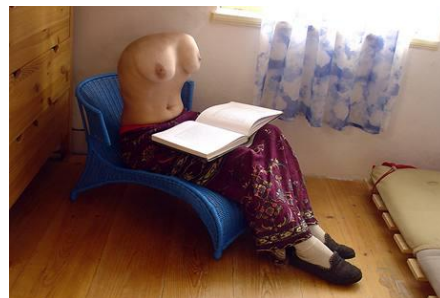
Obrázok 7 Lenka Klodová Pojmenuj mě nově