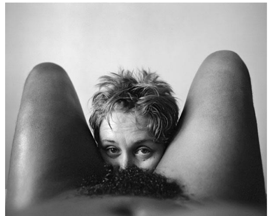
Obrázok 14 Zenele Muholi