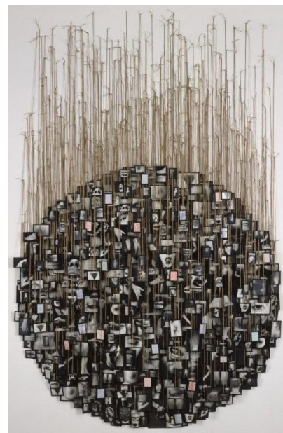
Obrázok 5 Annette Messager Mes Voeux

Vzájomné prenikanie rôznych fyzických osôb je silne surrealistické. Súvislý celok, ktorý inštalácia naznačuje je psychický stav v ktorom je pohlavie neuchopiteľné, alebo v ktorom sú pohlavia zameniteľné. Myšlienka sexuality, v ktorej pohlavie nie je dané, ale je vybrané a konštruované rovnako ako iné zložky našej ľudskej identity, informuje o týchto dielach ktoré sa menia s každým iným pohľadom pozorovateľa. 26