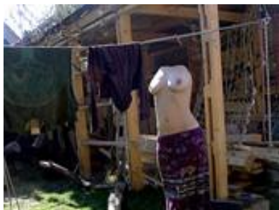
Obrázok 6 Lenka Klodová Pojmenuj mě nově