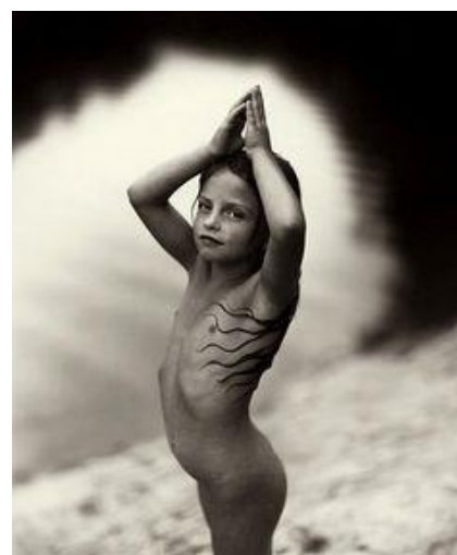
Obrázok 18 Sally Mann

keď bola dieťa, často bola nahá, tak zobrazila aj svoje deti. Takže vlastné detstvo umelkyne sa odráža v spôsobe akým zachytáva okamihy v živote svojich detí. Mannovej deti sú na fotografiách často nahé lebo to bolo pre nich prirodzené. Chcela aby sa jej fotografie podobali na rodinné momentky. Mann sama považovala tieto fotografie za prirodzené očami matky, pretože videla svoje deti šťastné, smutné, hravé, choré, krvavé, nahnevané a dokonca aj nahé. Autorka zaznamenala kombináciu spontánnych a starostlivo usporiadaných momentov detského pokoja, odhaľujúceho niekedy znepokojujúcu nápaditú hru.