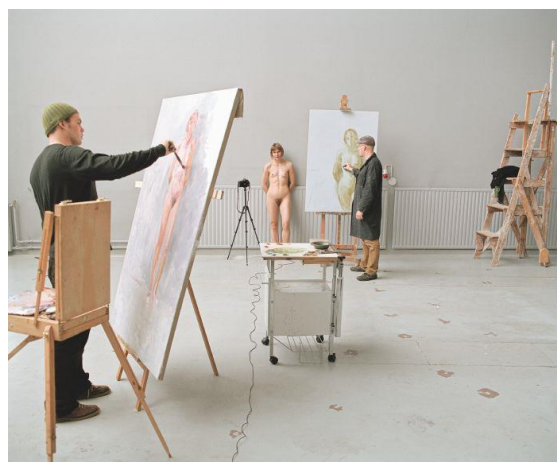
Obrázok 1 Elina Brotherus ARTISTS AT WORK

Zaujímavý pohľad na túto tému sa nám naskytá v diele súčasnej umelkyne Eliny Brotherus s názvom ARTISTS AT WORK (2009). Vo svojej práci si kladie otázky: kto sleduje koho? Kto je umelec a kto je model? Kto dostane "posledný pohľad"? Umelkyňa vytvorila situáciu kde pózuje ako model dvom maliarom a zároveň ich fotografuje pri práci pomocou dvoch fotoaparátov a samospúšte. Na fotografiách sa role miešajú model sa stáva tvorcom snímok a maliari sa stávajú modelmi. Zároveň autorka skúma aký vplyv má na prácu maliarov, keď sa model pozerá na nich, pozoruje pozorovateľov a zase robí ich portrét s vlastným médiom. 9