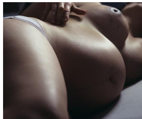
Obrázok 17 Jana Hojstričová Every day together

Súbor fotografií s názvom Every day together zobrazuje detaily tela pozmenené tehotenstvom. Na fotografiách môžeme vidieť tehotenstvom zväčšené brucho a prsia. Vďaka tlmenému svetlu a nedokonalostiam na koži ako napríklad, odtlačky od spodnej bielizne, vyznejú fotografie veľmi intímne. Detaily ukazujú každý záhyb kože, nerovnosť aj tukové vrstvy realisticky ale pritom veľmi nežne a láskavo.